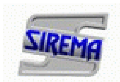
SIREMA Irányítástechnikai és Számítástechnikai Kft.